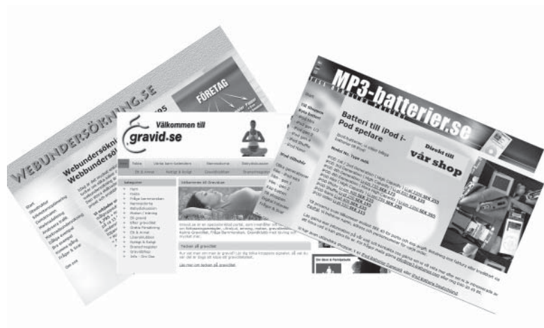
Några av mina aktiva internetsajter

Sedan dess har det rullat på med nya internetprojekt i lite olika bolag. De flesta sajter tjänar pengar, vissa bara några kronor per månad, andra betydligt mer. På vägen framåt har jag också insett att man inte får vara rädd för att misslyckas. Många av mina projekt har utvecklats negativt i början, men genom att följa utvecklingen noggrant går det ofta att styra rätt.